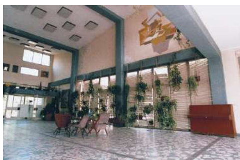
Слика 1.. Ентеријер матичне школе

Основна школа "Кадињача" (матична школа и издвојено одељење) ради у два објекта. Објекти се редовно одржавају и у добром су стању. Матична школа се налази у центру града, у непосредној близини предшколске установе "Бамби" и ниже Музичке школе. Окружена је пространим и добро одржаним парковима. Аутобуска и железничка станица се налазе у близини школе. Недалеко од школе су Градска библиотека и Дом културе "Вук Караџић". Издвојено одељење је удаљено око 2,5 km од матичне школе.