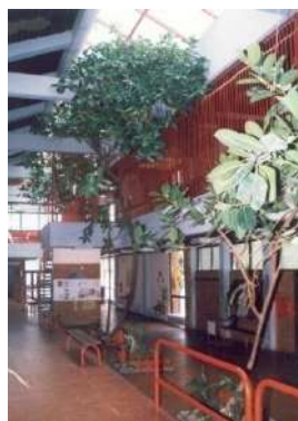
Слика 2. Ентеријер ИО

Основна школа "Кадињача" у Лозници организује редовну полудневну наставу у две смене у матичној школи и издвојеном одељењу. Смене се мењају месечно, јер се тако може најбоље организовати васпитно-образовни и други облици рада и због наставника који раде у другим школама.